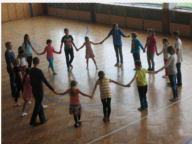
Taneční kroužek probíhá každý čtvrtek od 16.45 h.