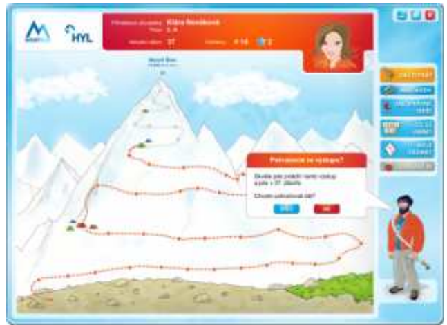
Eliška Hádková, 6.B

Je to nový program na psaní deseti prsty. Je formou hry. Hrajeme si v ní na horolezce. Máme tam různé tábory a po každých dvou táborech plníme klasifikační test. Abychom se dostali do tábora, musíme nejdříve opsat text správně. Za 5 hvězdiček je jedna jednička. Zkoušeli jsme první hodinu a podle mne je to lehčí, než ten program předtím. Ale uvidíme, jak to půjde dál.